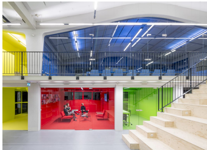
Elke ruimte heeft zijn eigen thema