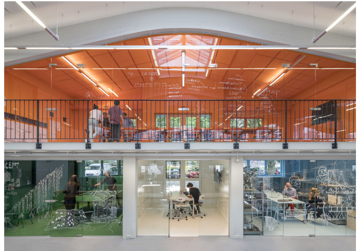
Interieur Vanuit bijna elke hoek in het kantoor kan men andere mensen in verschillende de ruimtes zien.

De vijf oorspronkelijke bogen waar dit kantoor uit bestaat zijn in stand gehouden bij de renovatie. De middelste drie bogen zijn opgebroken tot grote lichte ruimtes en alle ruimtes zijn afgescheiden met glazen wanden en deuren om de transparantie te vergroten. Vanuit elke werkruimte is weer een andere ruimte te zien. De werkruimtes zelf hebben allen een zelfde karakter en zijn uitgerust met door zelf MVRDV ontworpen werktafels die bestaan uit één lang blad zonder tussenpoten waardoor het team aan één tafel zit en samenwerken wordt gestimuleerd. Het sociale karakter van MVRDV is niet alleen te zien in de transparantie van het gebouw en de grote open ruimtes, het is ook terug te zien in de 30 meter lange eettafel waar men dagelijks samen luncht, het feit dat de directie in een bescheiden ruimte zit, uniseks toiletten en een muur met familiefoto's.