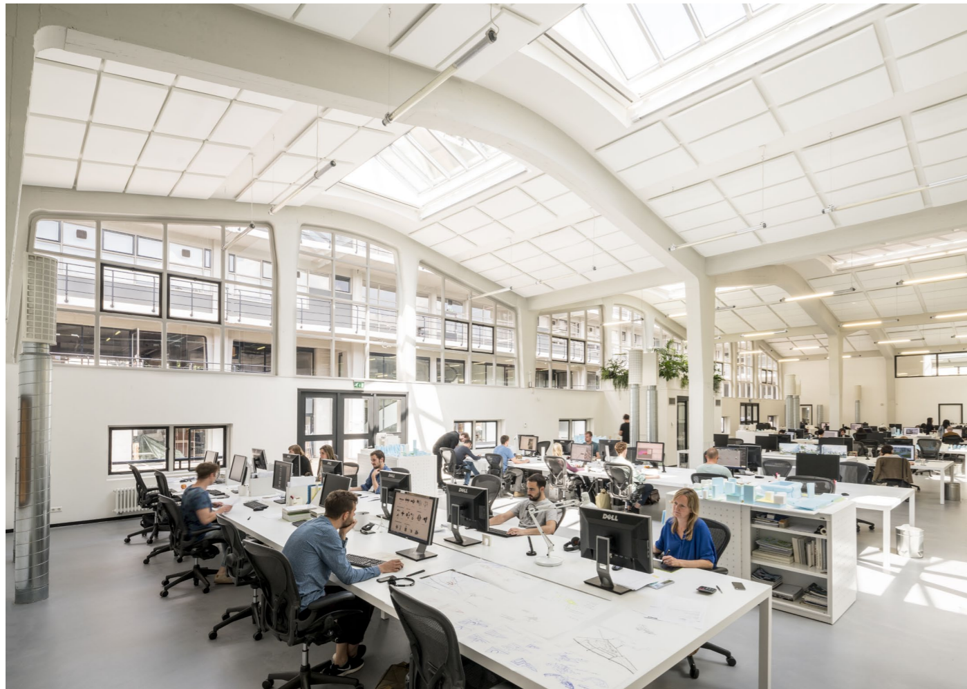
De werkruimtes ademen allen dezelfde sfeer. Op maat gemaakte tafels voor teams bestaan uit een groot blad zonder tussenpoten, wat samenwerken bevordert.