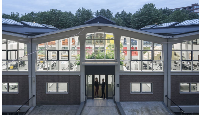
Het monumentale gebouw is ontworpen door de bekende Nederlandse naoorlogse architect Hugh Maaskant.

MVRDV opende in april 2017 officieel haar nieuwe kantoor in het centrum van Rotterdam. Met de verhuizing is een nieuw tijdperk aangebroken voor het groeiende architectenbureau dat inmiddels 200 medewerkers telt. Het nieuwe thuis bevindt zich in het monumentale Industriegebouw ontworpen door de naoorlogse architect Hugh Maaskant. Het is gelegen in het Hoogkwartier vlakbij de door MVRDV zelf ontworpen Markthal. Het 'MVRDV House' biedt nieuwe en uitgebreidere faciliteiten voor het bureau en is volledig naar stijl van de eigen visie ingericht.