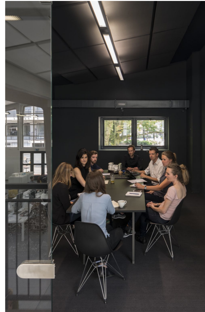
Vergaderruimtes Elke ruimte heeft zijn eigen thema en inrichting voor verschillende soorten meetings.