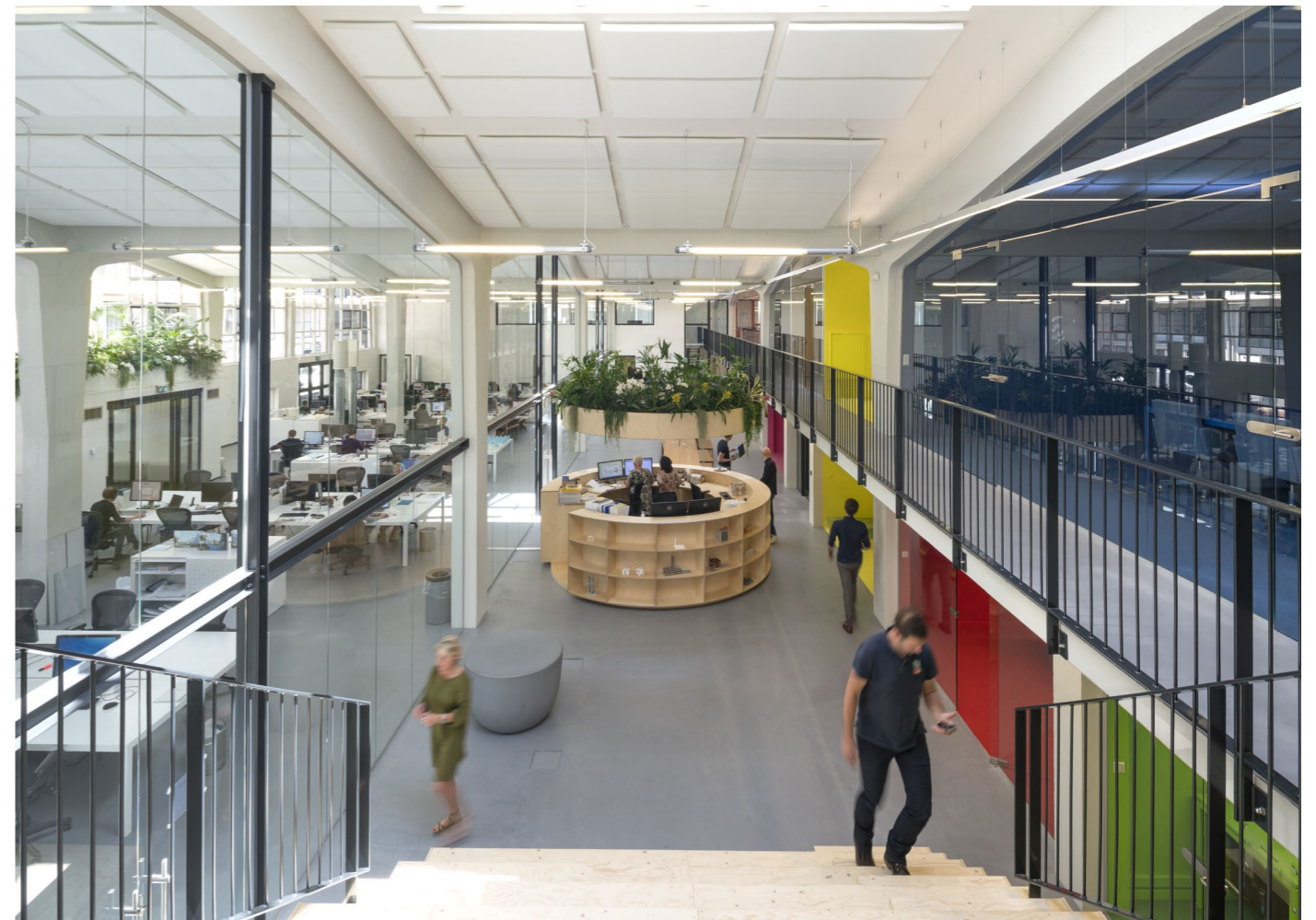
The grote family Room is het middelpunt van desociale interactie. Men ziet drie uitvergroete woonelementen terug in deze ruimte: de bank, de eettafel en de plantenluchter.