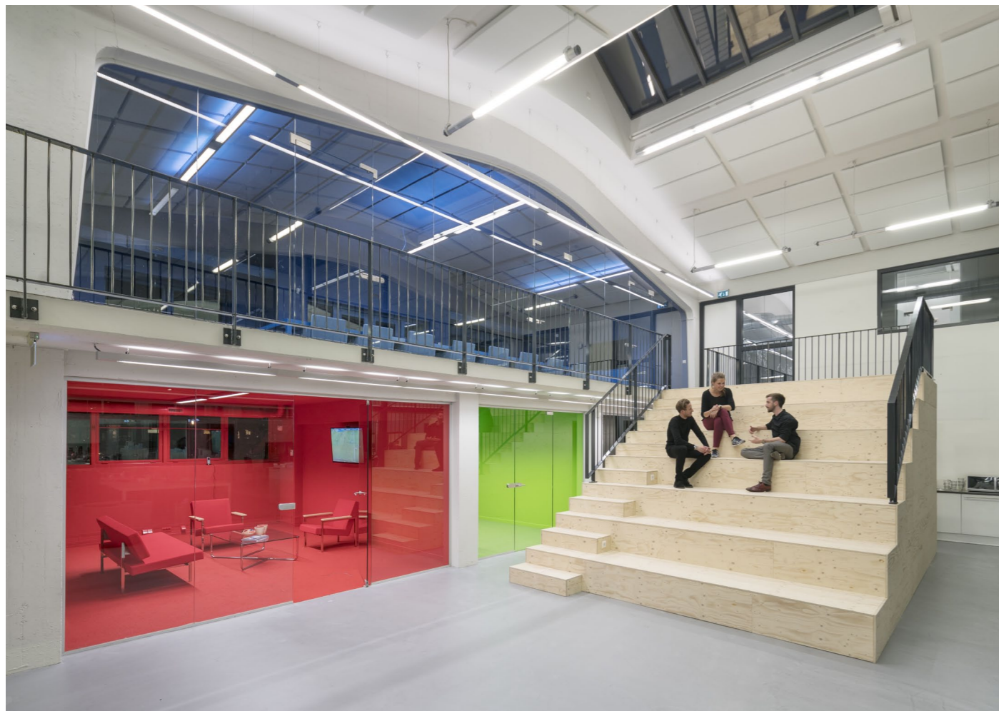
De Bank is grote tribune waarvoor een dia-scherm kan worden uitgerold voor lezingen, presentaties of om voetbalwedstrijden te kijken.