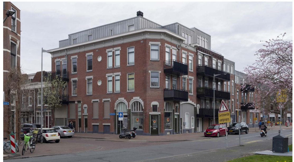
Hoek Tolhuislaan - Rechthuisstraat in 2024