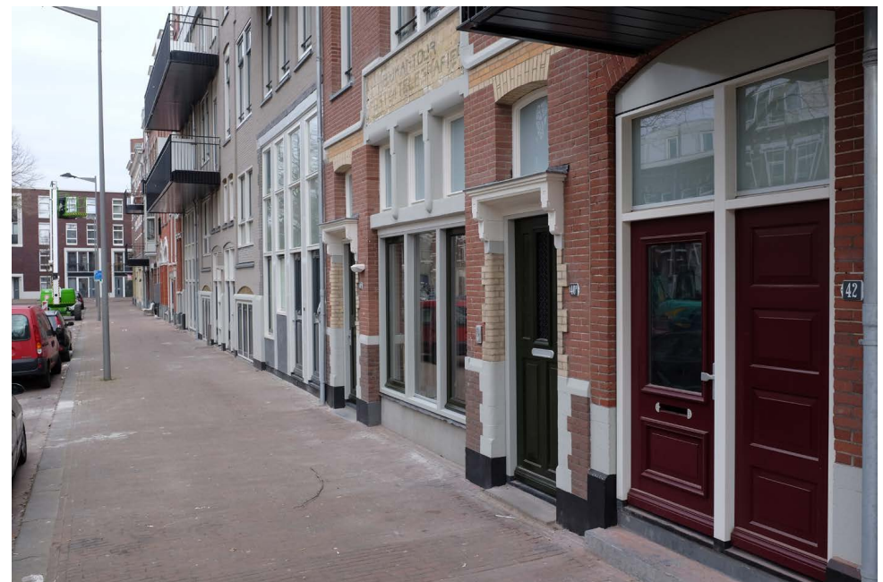
De begane grond na renovatie