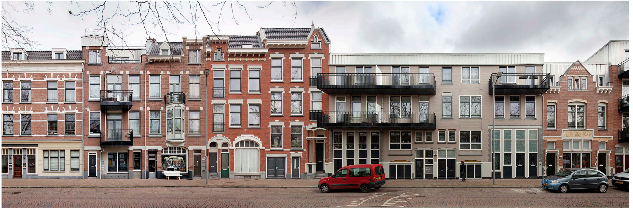
De Rechtshuislaan na renovatie