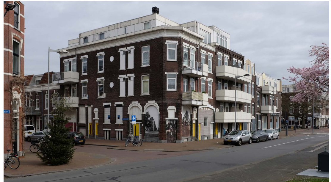
Hoek Tolhuislaan - Rechthuisstraat in 2020