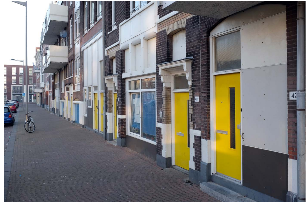
De begane grond voor renovatie

De panden zijn verduurzaamd in bewoonde staat. Dat betekende voor de bewoners dat ze hun geliefde wijk niet hoefden te verlaten en dat ze voor dezelfde huur eindelijk achter een gevel mogen wonen waar je jezelf niet voor hoeft te schamen.