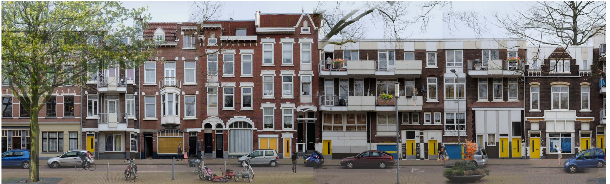
De Rechtshuislaan voor renovatie