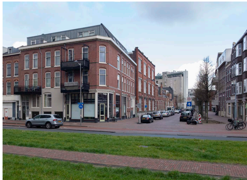
Tolhuisstraat gezien vanuit de Tolhuislaan