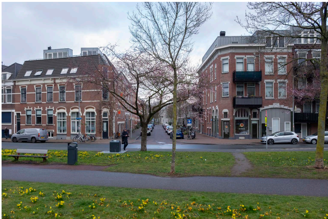
Links koop, rechts sociale huur. De Rechthuisstraat gezien vanuit het Kaapark