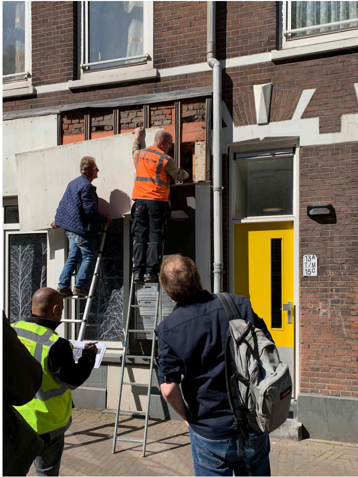
Wat komt er achter de Trespa plaat vandaan?