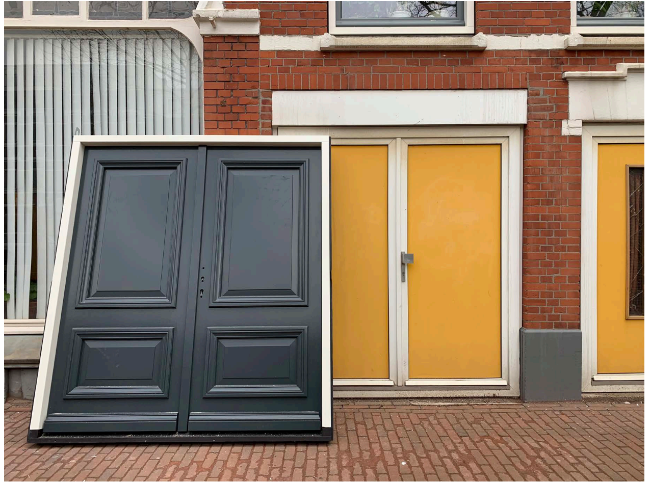
Nieuwe bergingsdeuren staan klaar om de kanariegele te vervangen.